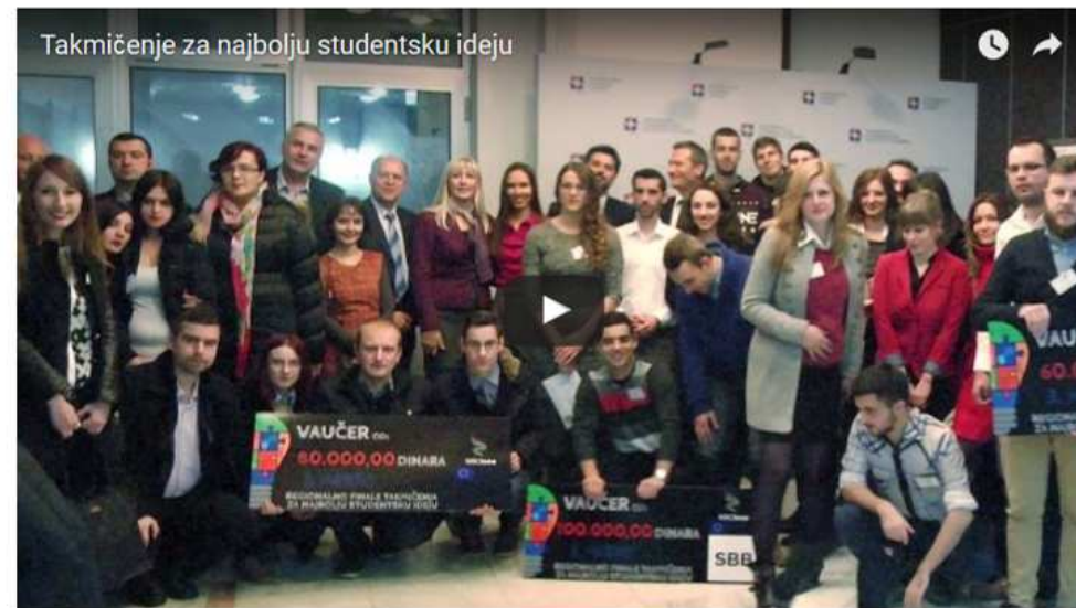
Takmičenje za najbolju studentsku ideju

AKTUELNI KONKURSI COST poziv za predlaganje novih akcija 13 JAN, 2016